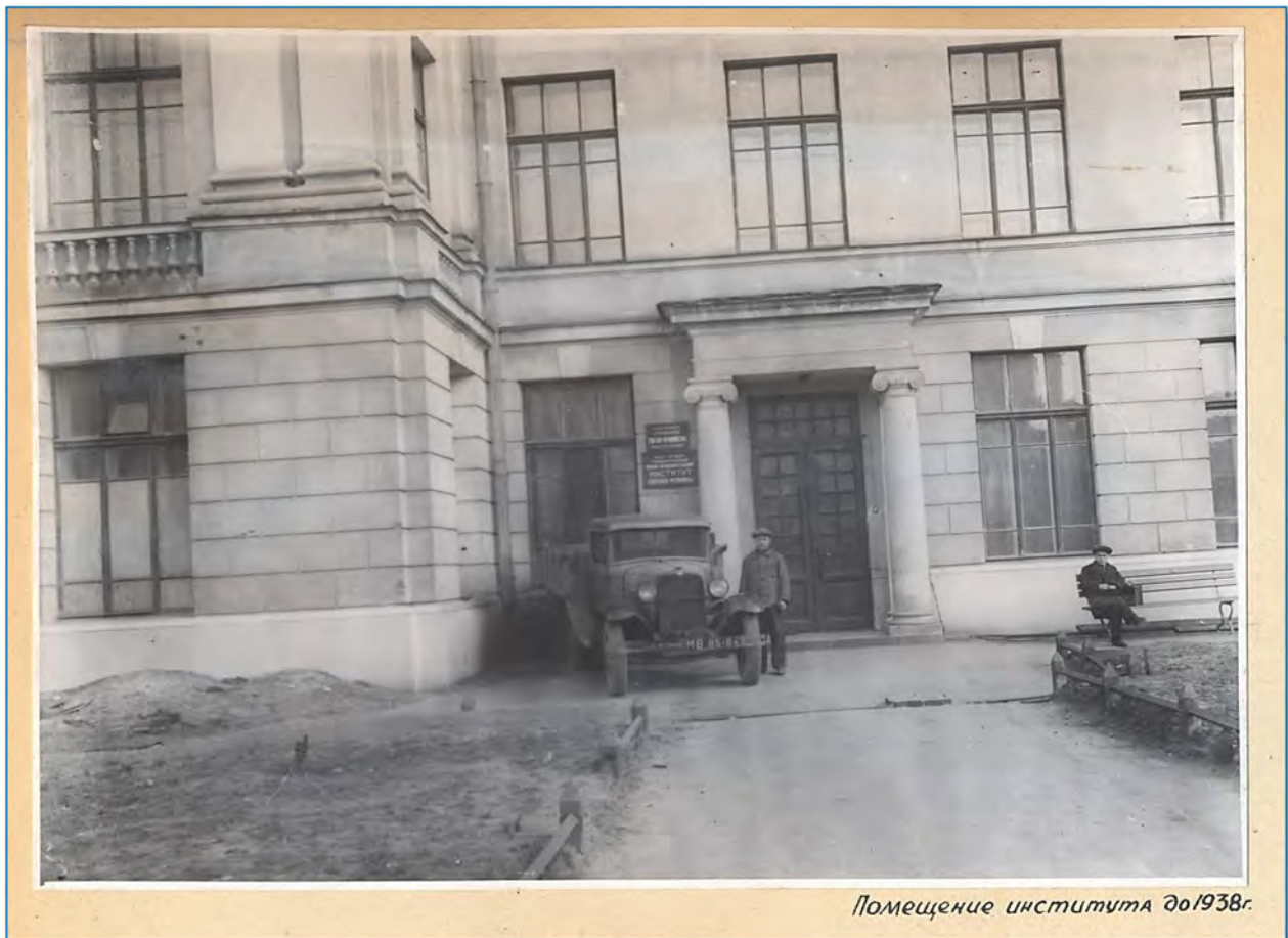
Помещение института до 1938г.